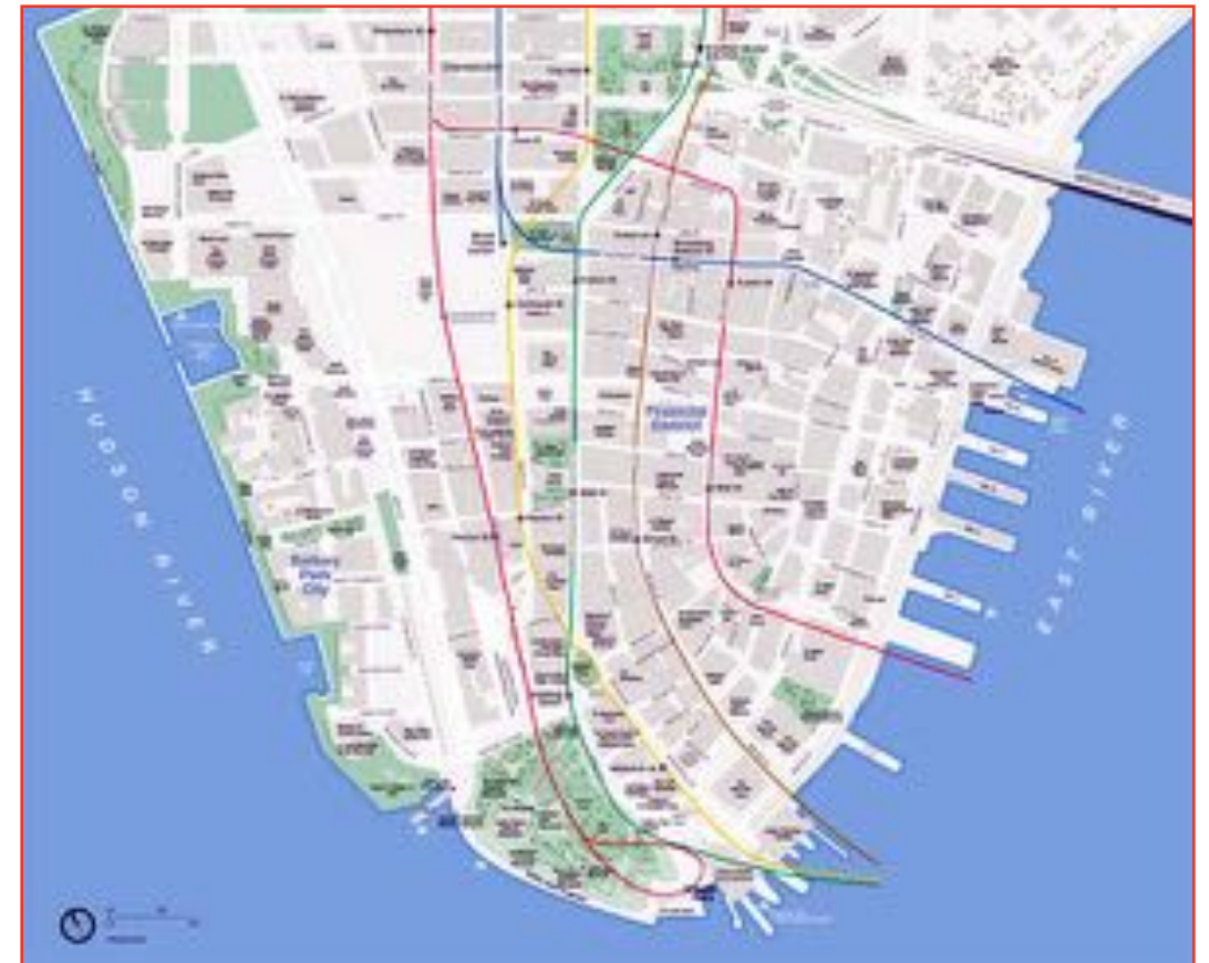
Downtown of Manhattan

Visutý řetězový most, druhý z mostů na jižním Manhattanu typických pro panorama tohoto ostrova, si lze dobře prohlédnout z Brooklyn Bridge Promenade. Je delší než Brooklynský most – měří 2089 metrů, byl dokončen v roce 1909 a vedle dvou pruhů v každém směru pro automobily má i čtyři koleje pro podzemní dráhu a stezku pro cyklisty a chodce ve své spodní části.