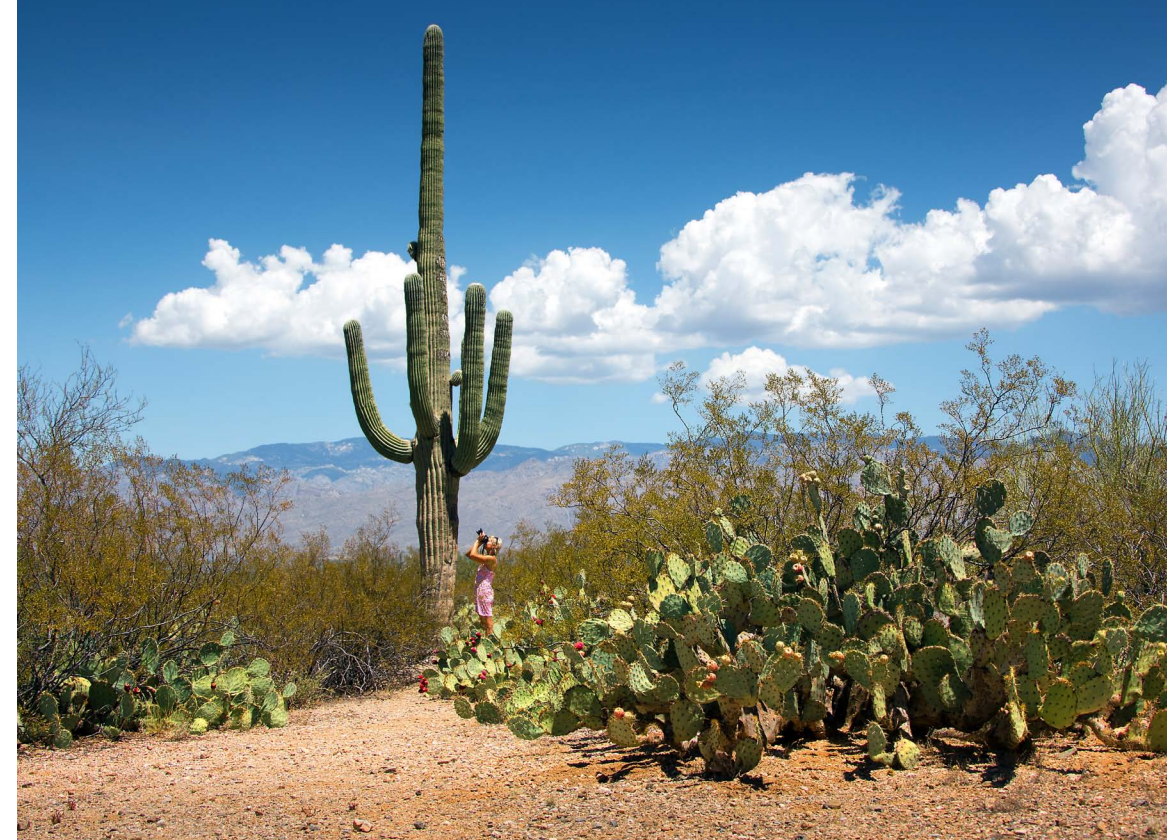
Saguaro kaktus ( Carnegiea gigantea ) je vlastně původní indiánský název pro tyto největší kaktusy světa. V Sonorské poušti dorůstají běžně do výšky desíti metrů, jsou však popsány i exempláře o výšce 20 metrů.

K horám Diablo Mountains vede prашná silnice Ajo Mountain Drive. Kdo nedojede až k horám, může se z mnoha krásných kaktusů „Saguaro“ i z „Teddy Bear Cholla“ těšit v okolí návštěvnického centra.