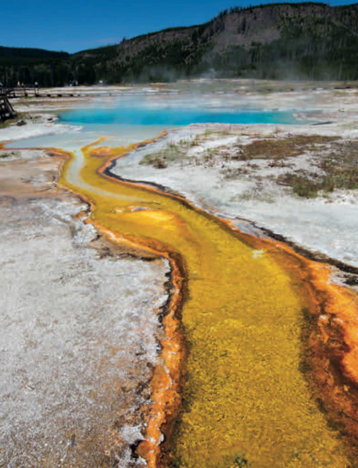
Sírově žlutý potok se vlévá do Biscuit Basin.