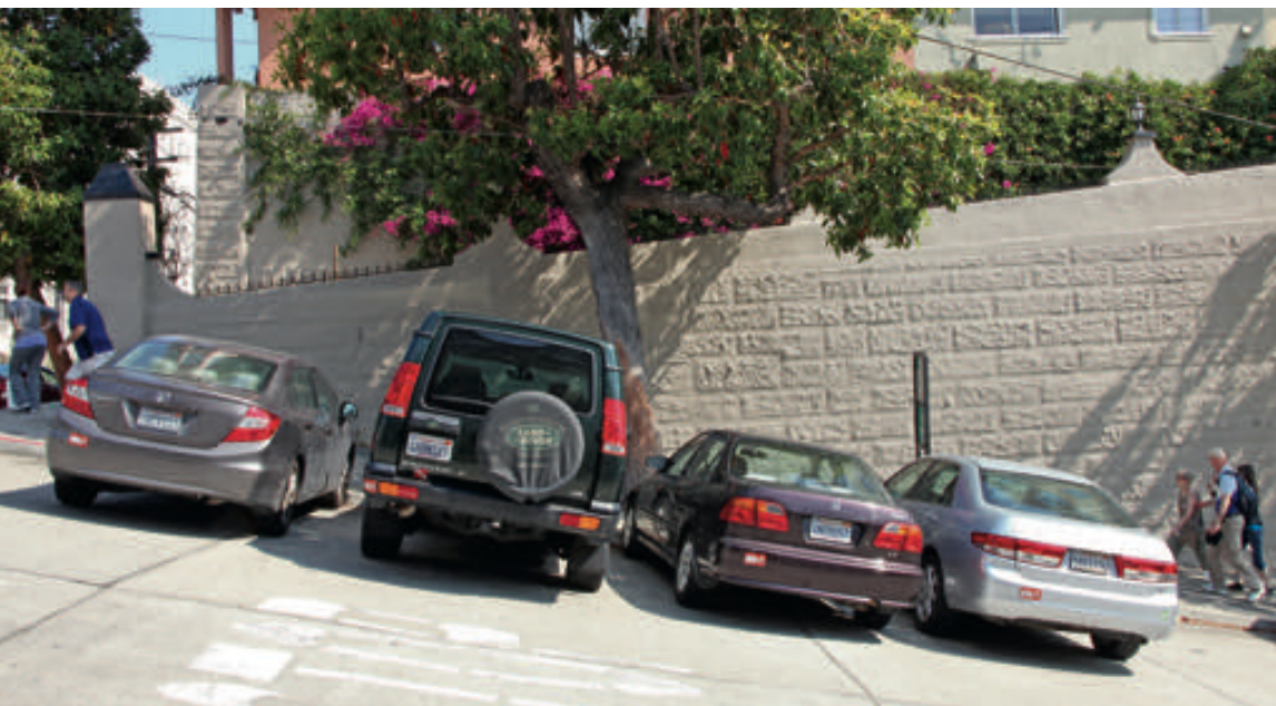
Lombard Street pokračuje ale i dolů pod těmi nejznámějšími serpentinami. O tom, jak je i zde strmá, svědčí zaparkovaná auta.