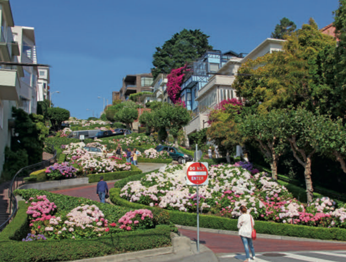
Lombard Street za dne: Když si do navigace zadáte 2000 Leavenworth Str., přijedete přímo pod serpentinu ulice Lombard. V ulici Leavenworth můžete zaparkovat a pohled na Lombard Street si užít i za dne.