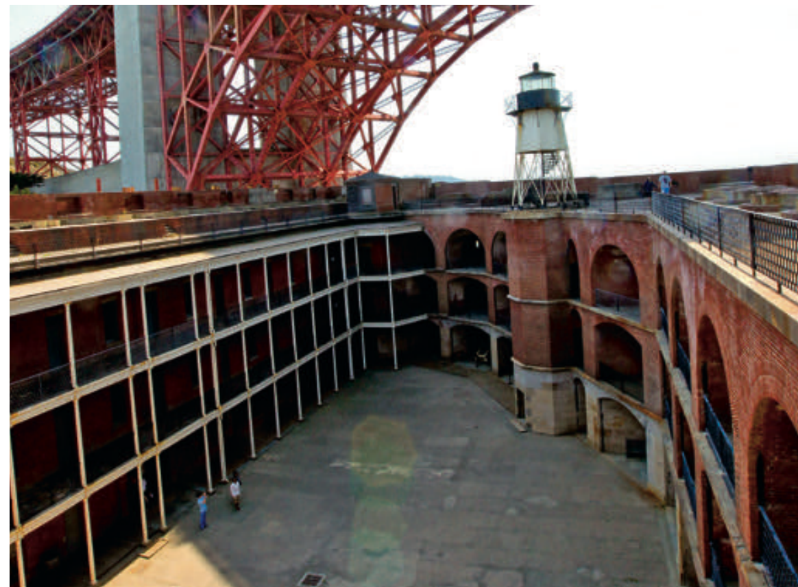
Pevnost Fort Point je vysoká, má tři patra, a přesto se celá vešla do jižního oblouku mostu Golden Gate Bridge. Vybuďovala ji v roce 1861 americká armáda a měla za úkol střežit Sanfranciskou zátoku před vojenskými útoky. Nikdy však nemusela čelit napadení a po zemětřesení v roce 1906 byla natolik poškozena, že se uvažovalo o zbourání. K tomu nakonec nedošlo ani ve 30. letech, kdy se stavěl Golden Gate Bridge. Dnes je v ní muzeum schraňující vojenské uniformy a zbraně, vstup je zdarma.