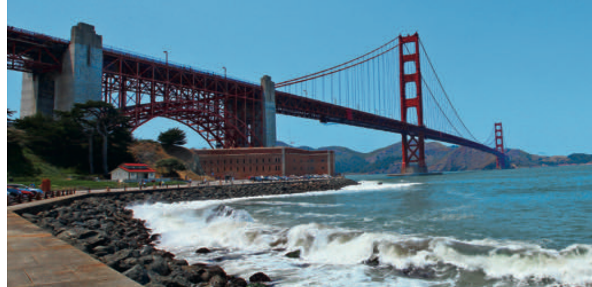
Golden Gate Bridge. Několik let jsem hledal místo, odkud by bylo možné celý most vyfotografovat tak, aby vynikla jeho mohutnost. Až nyní jsem to místo našel, a tak se s vámi o tu informaci podělím. Z mola Torpedo Wharf vidíte celý most v plné kráse a navíc je to odtud jen malý kousek k historické pevnosti Fort Point, která stojí pod jižním obloukem Golden Gate Bridge a zůstala neporušená i po postavení mostu. Když zadáme do navigace 983 Marine Dr., dojedeme přímo k molu Torpedo Wharf.